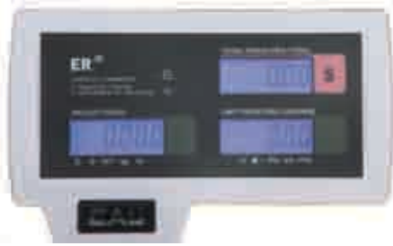
Client view Côté client