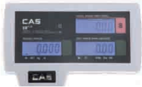
Client view Côté client