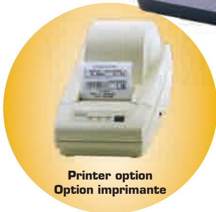
Printer option Option imprimante