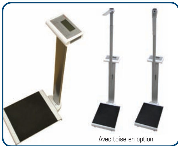
Avec toise en option